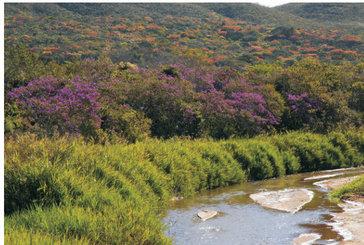
Parque Estadual do Biribiri