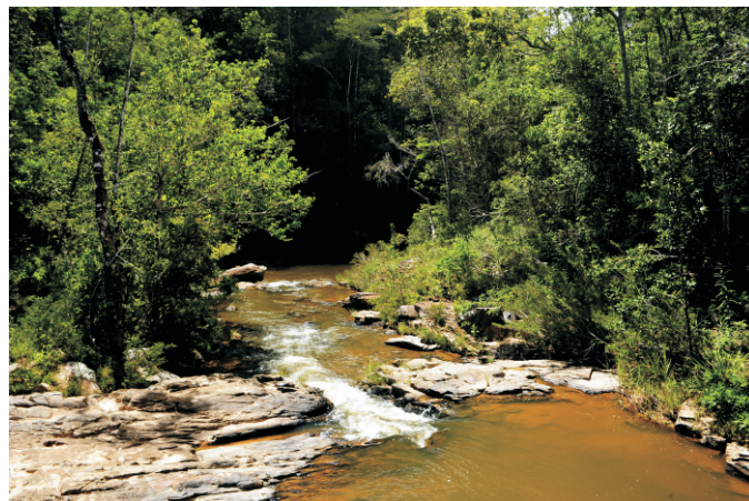
Parque Estadual do Limoeiro

Para informações adicionais referentes à pesquisa, consulte o site eletrônico: http://www.ief.mg.gov.br/noticias/1/1821-pesquisa-cientifica ou entre em contato com a Assessoria de Programas e Projetos Especiais, telefone (31) 3915-1326.