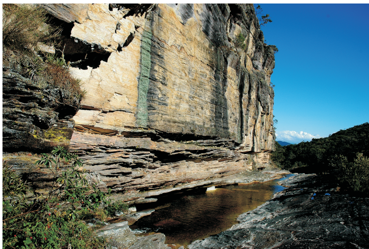
Parque Estadual do Ibitipoca