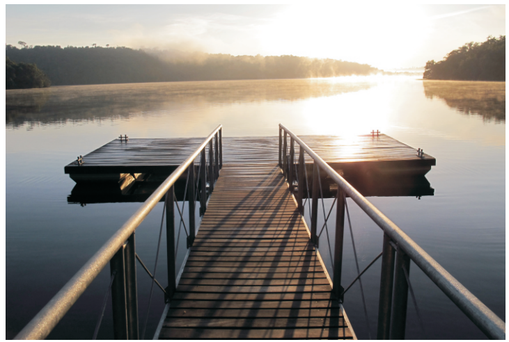
Parque Estadual do Rio Doce