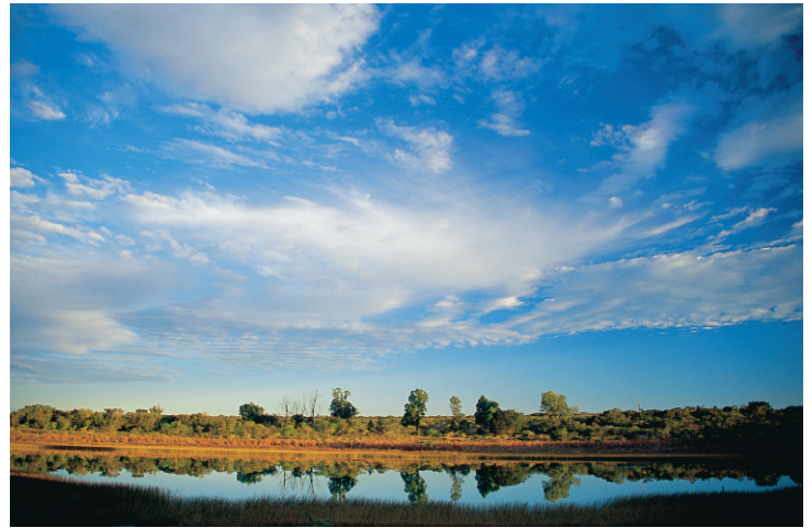
Parque Estadual Veredas do Peruaçu