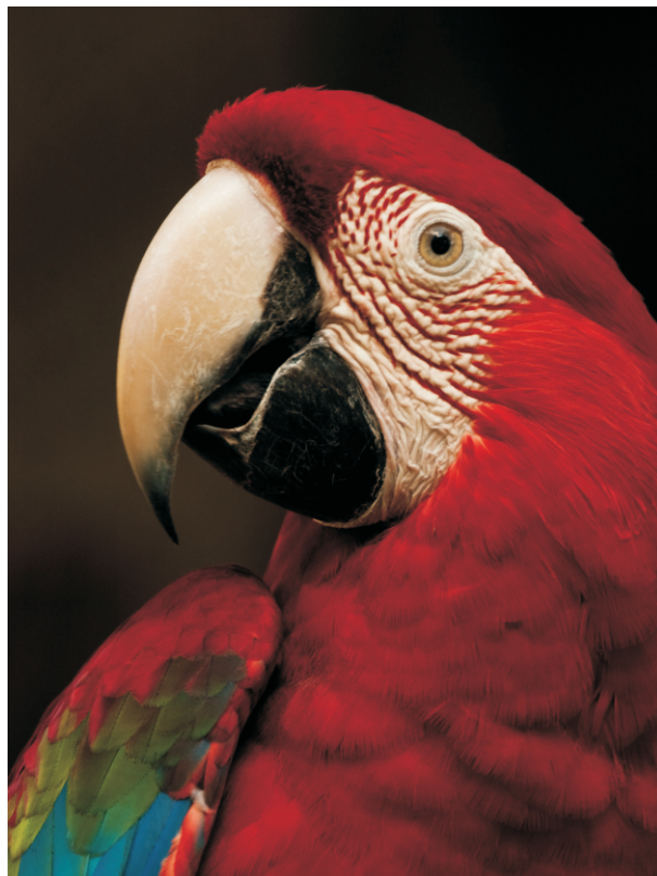
Parque Estadual Serra das Araras