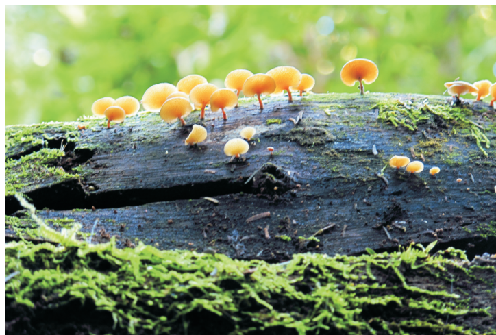
Parque Estadual Nova Baden