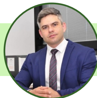
Secretário de Estado de Meio Ambiente e Desenvolvimento Sustentável Germano Vieira