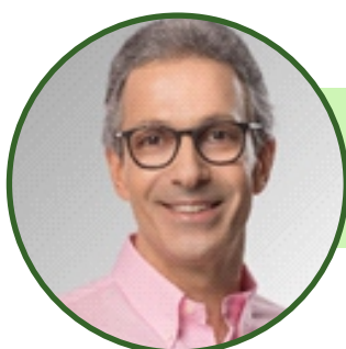
Governador do Estado de Minas Gerais Romeu Zema