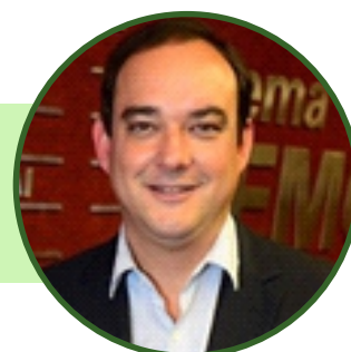
Presidente da Federação da Indústrias do Estado de Minas Gerais Flávio Roscoe